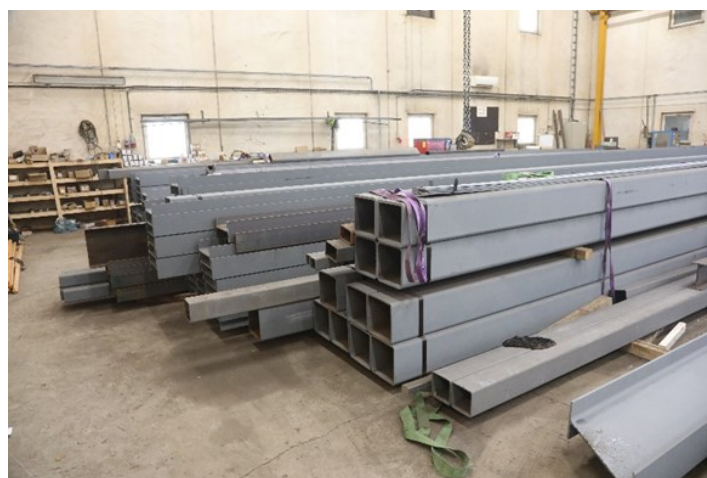
Komponenter i stål klar til montering