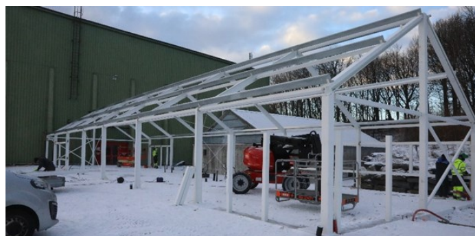
Foaje bygget på det nærmeste klart for montering av elementer i vegger og tak