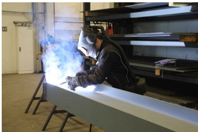
Sveising av ramme til utstillingshallen