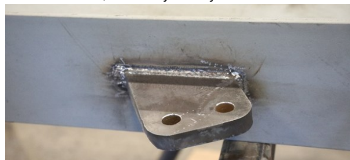
Feste for oppheng av fly