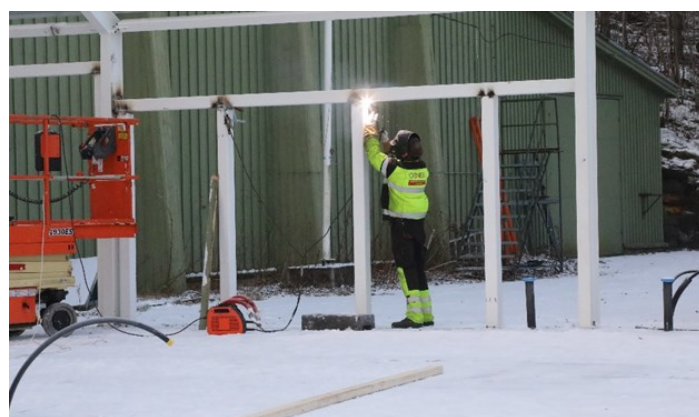
Sveising av innramming for dører

Arbeidet med nybygget går videre, med montering av foaje bygget. Etter at rammen er kommet opp monteres innramming for dører og vinduer før veggelementene monteres. Mens montasjearbeidet pågår i Sømmevågen sveises rammene for utstillingshallen hos Stavne og Vigrestad på Vigrestad.