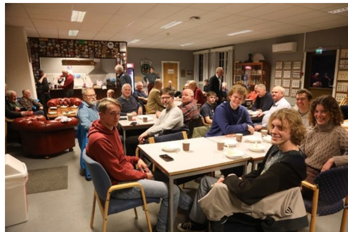
Også våre gode hjelpere fra Sola vgs deltok