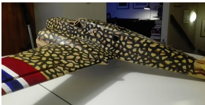
Modell av Caproni i det vi mener er korrekte farger.