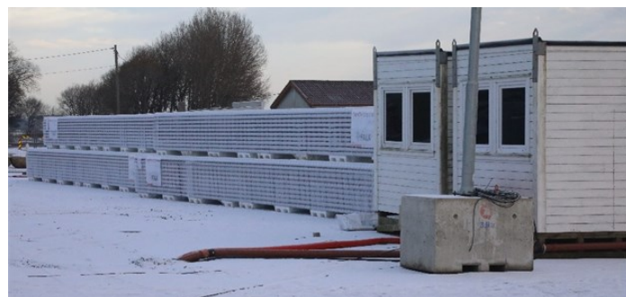
De første veggelementene er levert fra leverandøren i