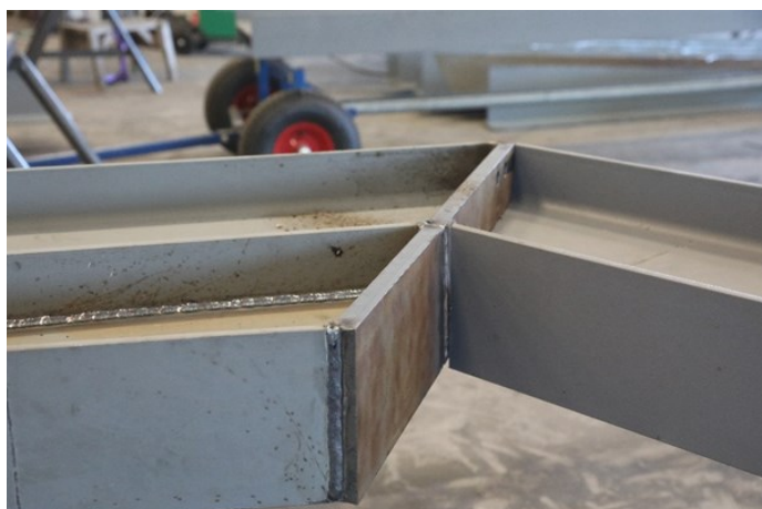
I mønet må bjelkene forsterkes