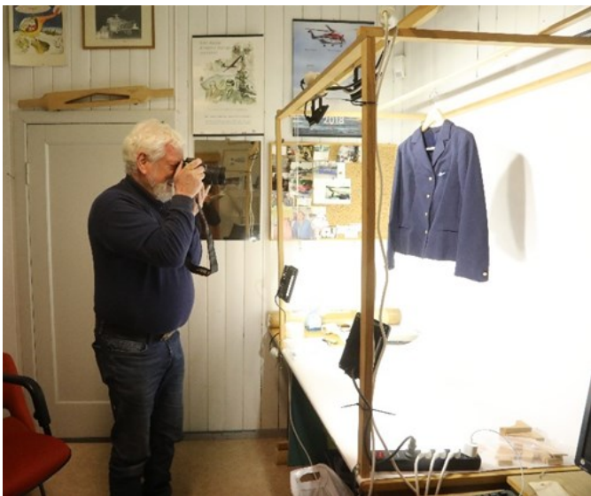
Roar i gang med fotografering av uniformen.