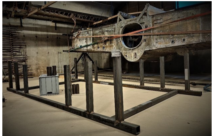
Jiggen under bygging

Det er et mye grubling nå konkludert med en løsning som teamet nå jobber med å bygge opp.