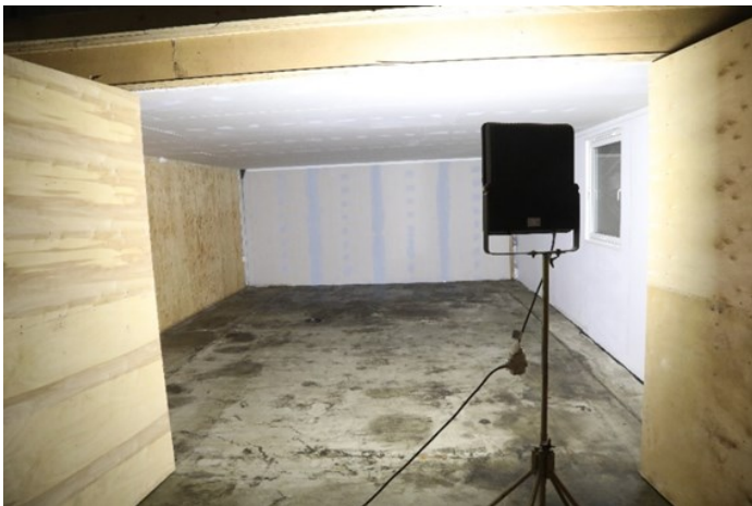
Her nærmer det seg ferdigstilling