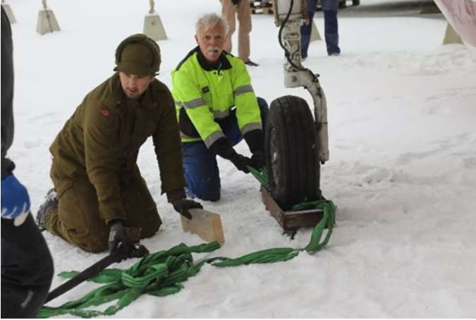
Ute var det snø den lørdagen, som var en ekstra kompliserende faktor