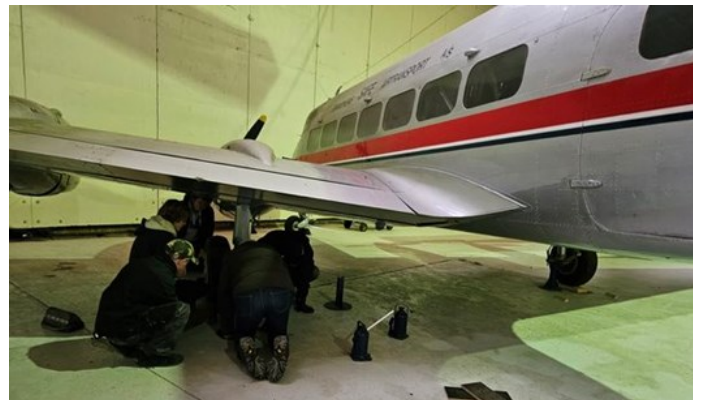
Den neste var Heron