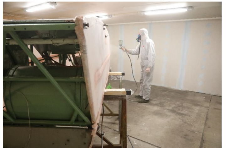
Siegfried i gang med lakkering.