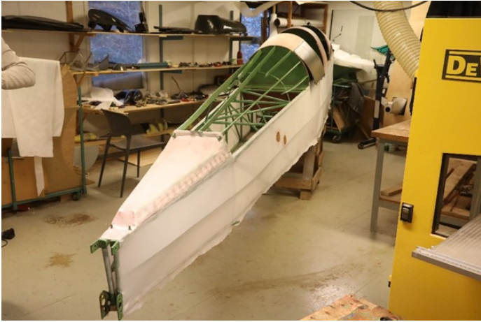
Neste skritt var å legge på ny duk.