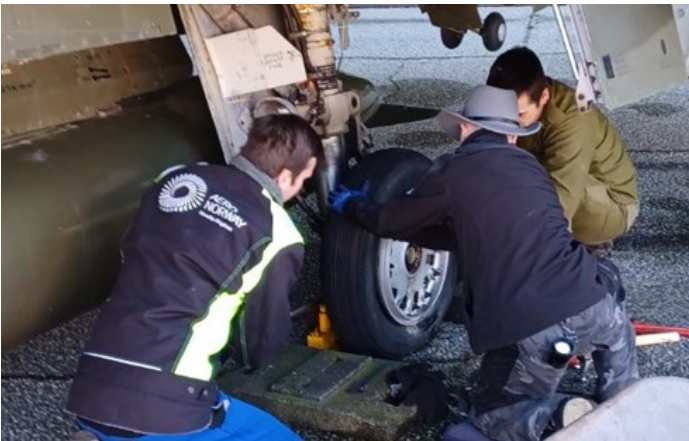
Hjulet skal av