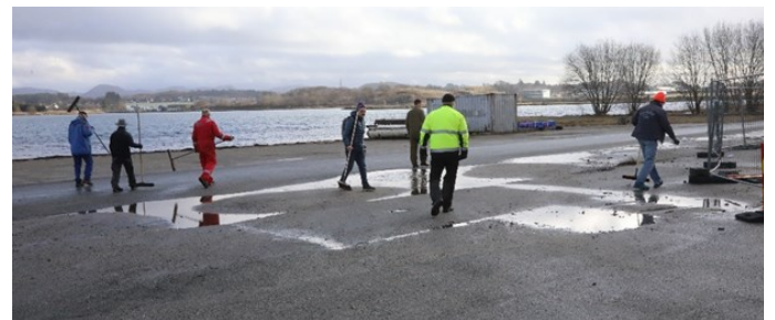
Også veien måtte få en omgang