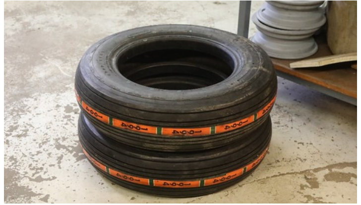
Nye dekk fra Sverige

To av dekkene var ødelagt etter mange års lagring av flyet delvis utendørs. Nå må flyet igjen flyttes for å få DC 6 tilbake utenfor inngangen til museet. Vi kunne ikke fortsette å flytte flyet på flate dekk. Museet har fått nye dekk i gave fra det svenske flyvåpenets historiske skvadron. Så da måtte de gamle dekkene av. Det viste seg meget krevende, det meste var ganske fastrustet etter mange års utendørs lagring. Resultatet ble mange timers stritt arbeid og store mengder rustløsende midler.