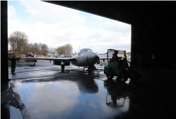
Så ble den det første flyet inn i nytt bygg