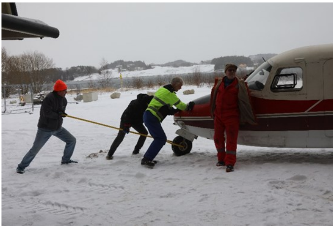
Litt manuelt arbeid må til