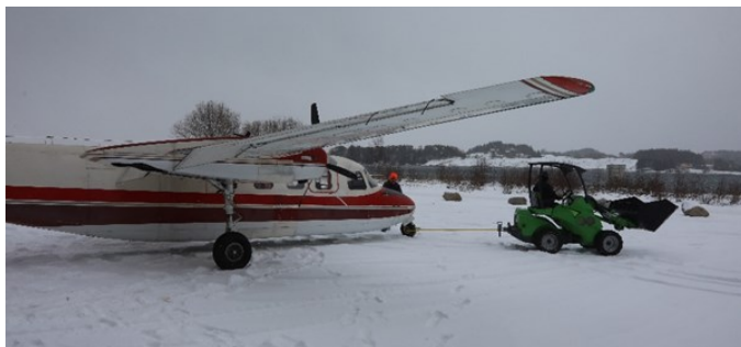
Så kunne en liten traktor ta den vekk fra porten