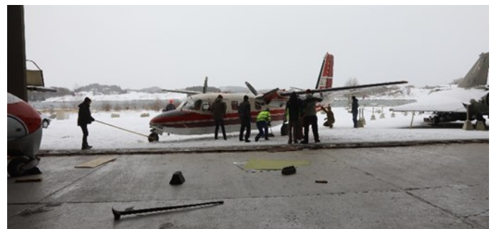
Så var det Aero Commander som måtte skyves sideveis ut. Den må bli stående ute inntil videre for å få nok manøvreringsrom i hangaren.