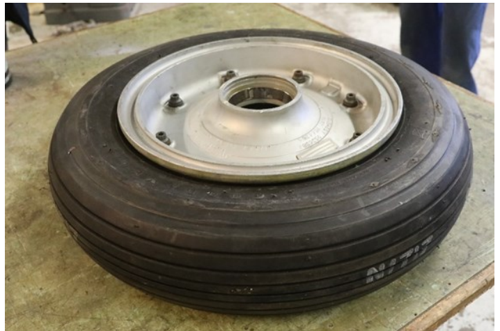
Nesehjulet er satt på felg