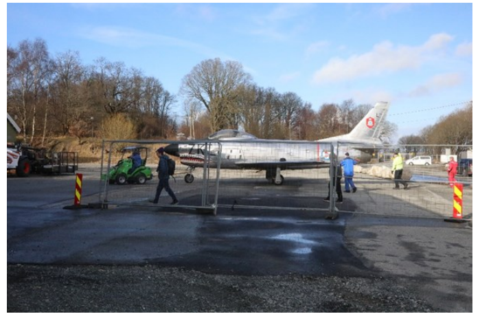
Og slepes over til den nye hallen