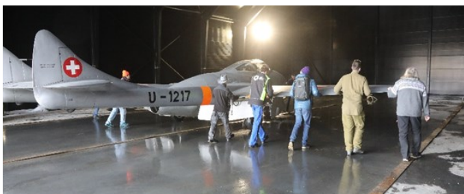
Så ble den det første flyet manøvrert inn i nytt bygg