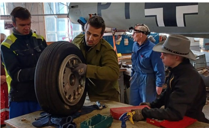
Så må dekket av felgen.