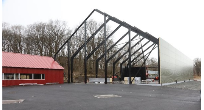
Neste skritt var å starte å kle hallen