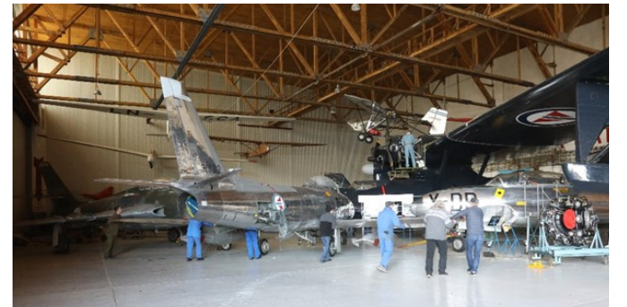
Så var det F-Saberen som måtte forsiktig bukses frem til portåpningen