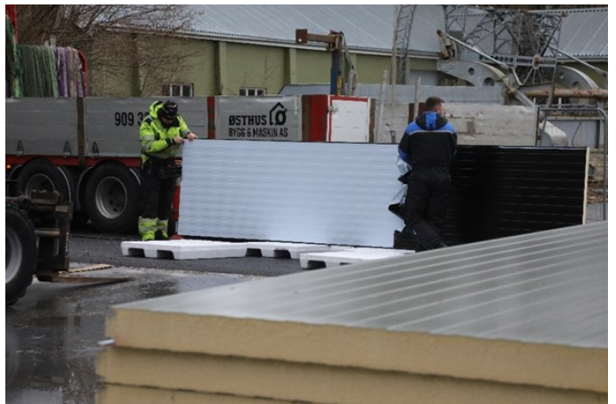
Byggene blir kledd med sandwich-elementer. En rasjonell byggemetode.