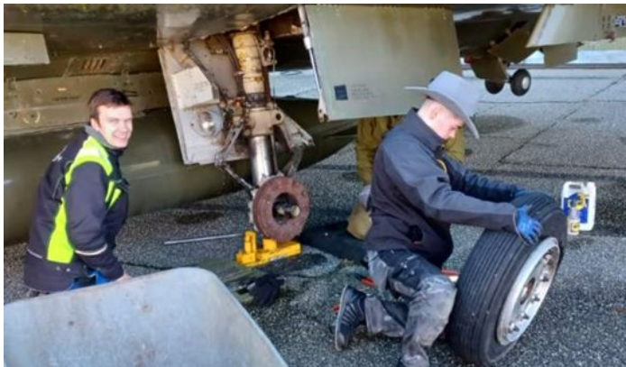
Til slutt kom det av