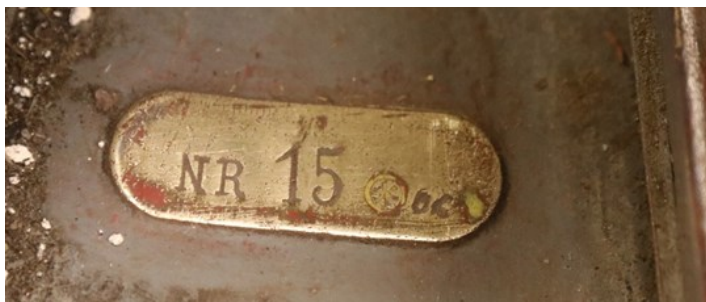
Etter at den gamle duken var fjernet kom dette messingskiltet frem, som antagelig er produksjonsnummeret fra fabrikken på Kjeller.