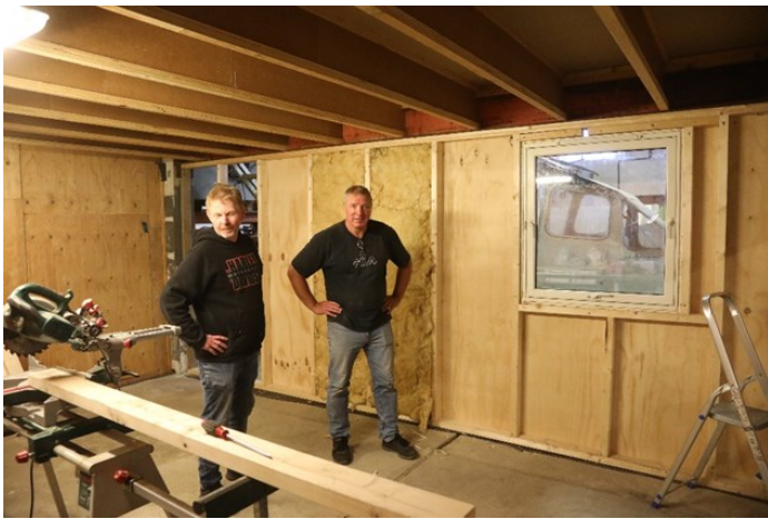
Lakkrommet på Stangeland under bygging