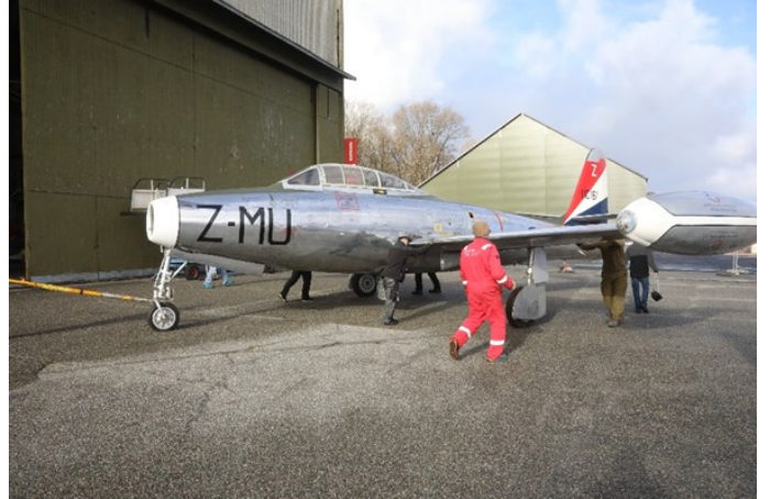
Den ble parkert midlertidig utenfor.