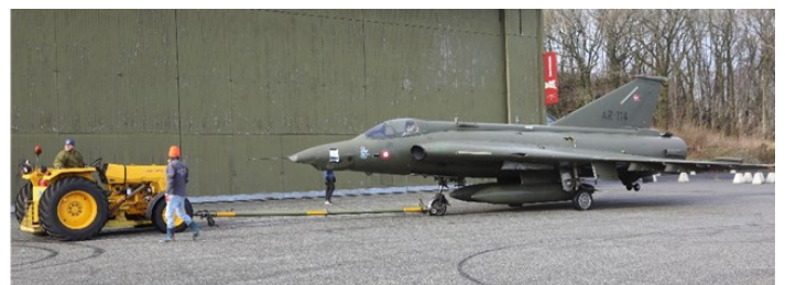
Her blir den slept til der den har stått ved hangaren mens byggearbeidene pågår.

Problemet er at slepet som er vist på disse bildene måtte gjennomføres med to av hjulene på flate dekk.