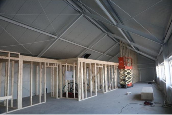
Reisverket til skilleveggene i foajebygget er kommet opp, men ikke mer vil bli gjort før det er skaffet til veie mer penger