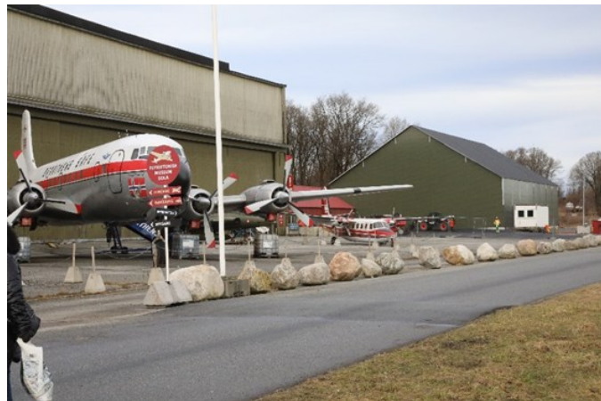
Og dette er status nå