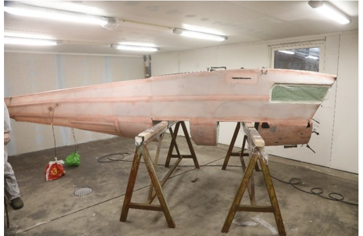
Skroget på plass i lakkrommet.