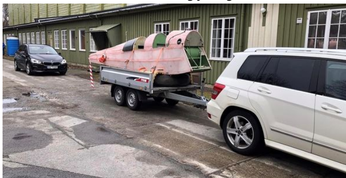
Så måtte skroget fraktes til Stangeland