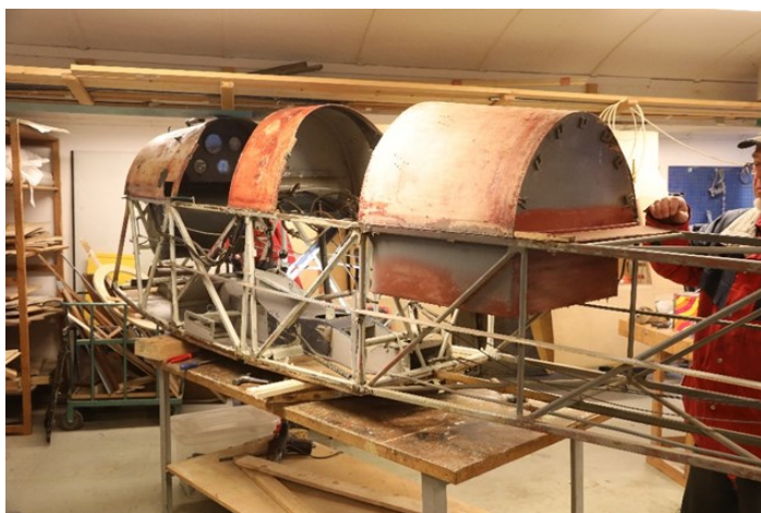
S kroget etter at den gamle duken var fjernet.