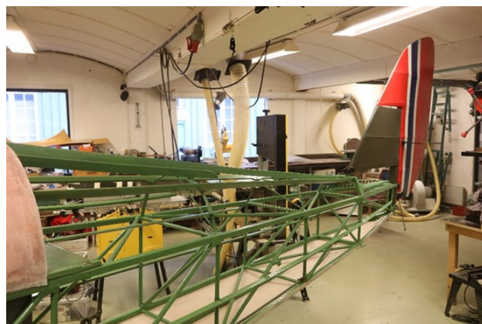
Etter at skroget var pusset ble det lakkert med grønnfargen det hadde opprinnelig.