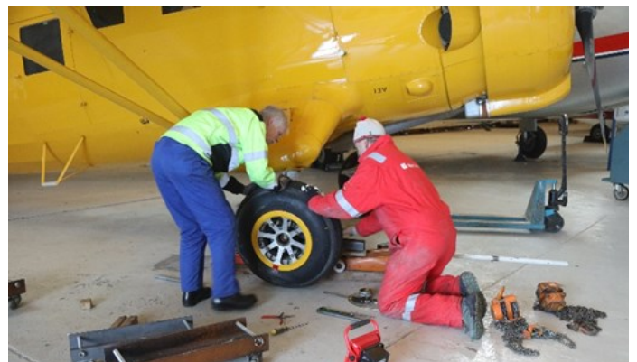
Den første som måtte flyttes litt var Norseman

Den store utfordringen er at alle flyene har vært satt svært tett for å unytte plassen. Det første flyet som skulle flyttes var Vampire, som er det første flyet som skal henges opp. Det sto gjemt bak flere andre fly, slik at det faktisk var fire andre fly som måtte flyttes før det var klar bane til å trekke ut Vampiren. Det meste av arbeidet gjøres på lørdager. Det er den dagen vi klarer å samle flest frivillige, og den dagen vi også får hjelp fra elevene på Sola vgs.