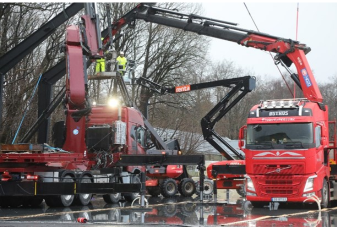
Så startet arbeidet med reisverket til utstillingshallen.