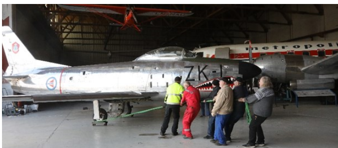
Den neste var K-Sabre som måtte tas sideveis et stykke før den kunne tas ut