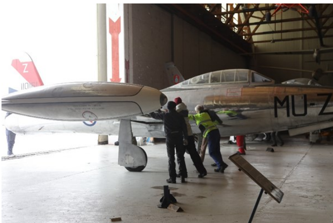
Den neste var Thunderjet som også måtte skyves ut for hånd