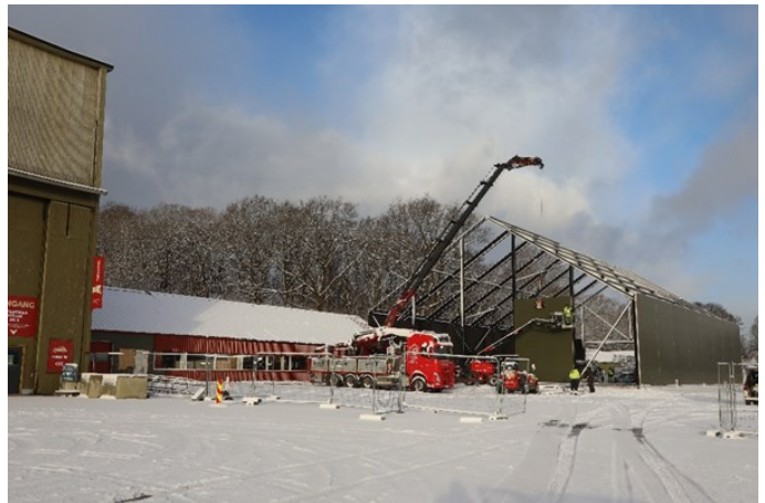
Så kom snøen. Det ble en forsinkende faktor. Det har vært mye dårlig vær i vinter som har forsinket byggearbeidene.