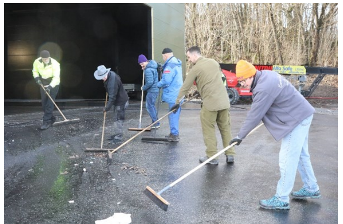
Før vi kunne slepe fly over til den nye hallen måtte gulvet sopes. Vi kan ikke risiker punkteringer på veien