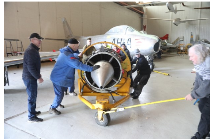
Før det neste flyrt kunne flyttes var det en motor som måtte flyttes