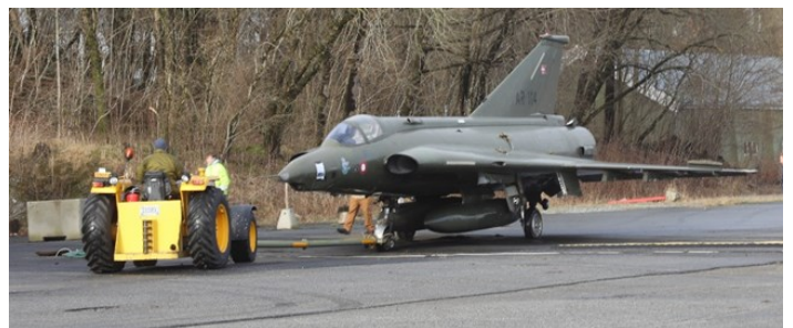
Draken sto lenge på nordsiden der vi nå bygger, og måtte flyttes før oppstart av byggearbeidene