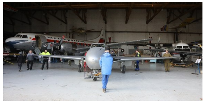
Så var det endelig klart for å slepe Vampiren ut.