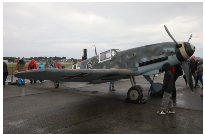
Bf 109 som statisk utstillingsobjekt.