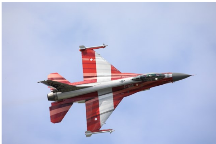
Dansk F 16