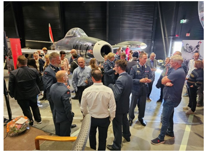
Et stort og interessert publikum