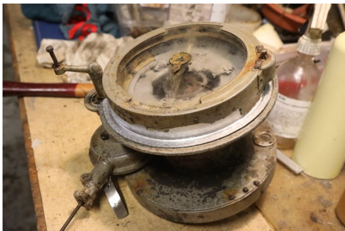
Egil Thomsen restaurer radiopøileren på He 115