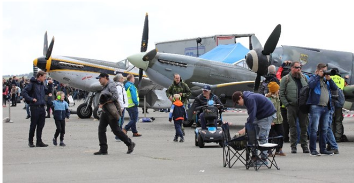
Det var ikke lett å få et brukbart bilde av tre sammen

Og så tar jeg med noen bilder av andre innslag