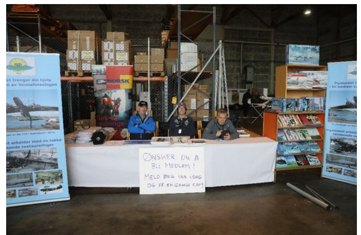
Venneforeningens stand på Sola Air Show.