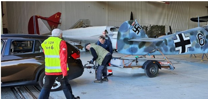
For å slepe Bf 109 ble halehjulet festet til en tilhenger