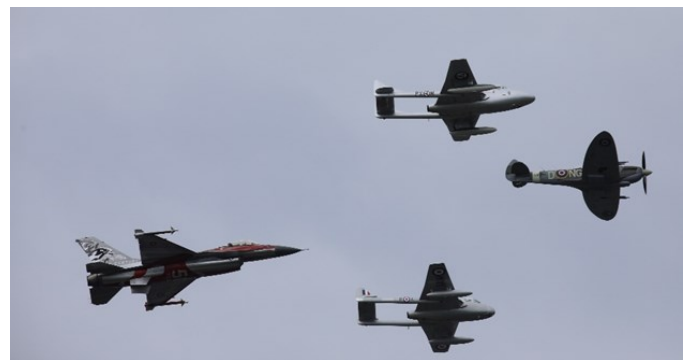
En blandet formasjon

Og så tar jeg med noen bilder av andre innslag