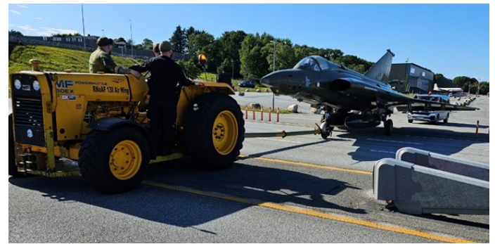
Til slutt kom Draken