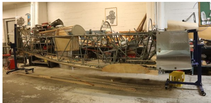
Rasmus Svihus er i gang med å platekle den fremre delen av kroppen på Ar 66