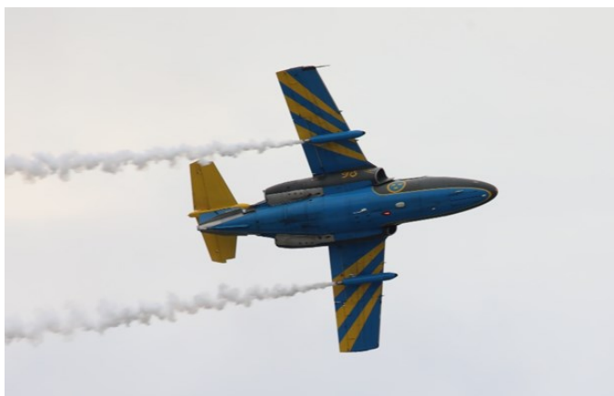
SAAB SK 60