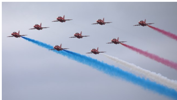
Avslutning med Red Arrows