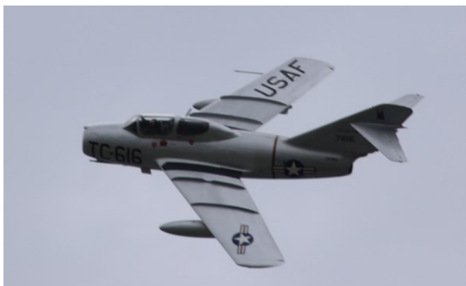
Mig 15 i amerikanske farger.