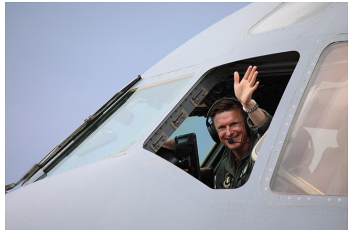
Den hadde en norsk flyger